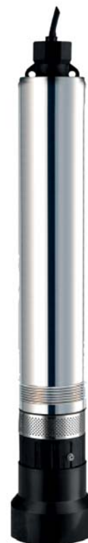
Descarga: 1 1/4"